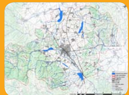
Mapa ugroženosti Uroševca od poplava