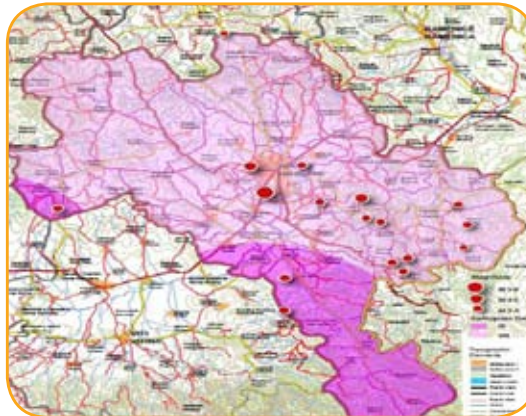
Mapa ugroženosti Gnjilana od zemljotresa

Proces pripreme komponente UPRK i identifikacije škole koja treba da bude ojačana je uključio sve zainteresovane učesnike. U toku ovog procesa održano je više prezentacija/konsultacija sa različitim učesnicima i predstavnicima građanskog društva. Posle njenog završetka, komponentu UPRK će usvojiti Skupština opštine kao integralni deo opštinskog i urbanističkog plana razvoja.