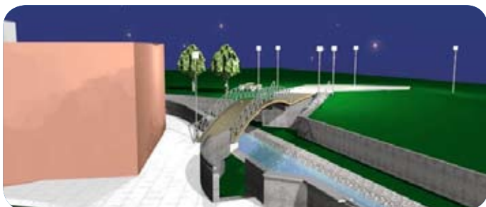
Slika 2: KIP u Uroševac

- Pretvaranje grada u atraktivno mesto za život kroz iniciranje poboljšanja vizuelnog izgleda ulica i ohrabivanje privatnih investicija (razvoj i upravljanje korišćenjem zemljišta)