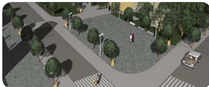
Slika 1: KIP u Đeneral Janković